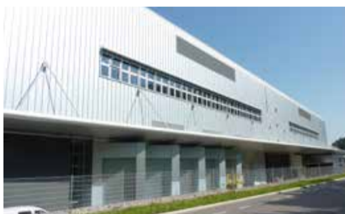
Aesculap AG, Tuttlingen Neubau Innovation Factory