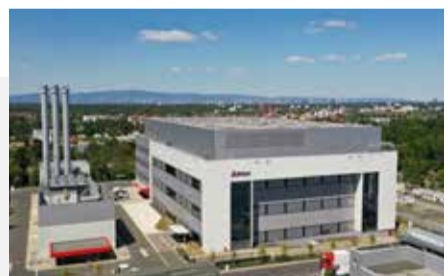
Biotest AG, Dreieich Neubau Produktionsgebäude

Haben Sie noch Fragen? Gerne helfen wir Ihnen unter life-sciences@dreeso.com weiter.