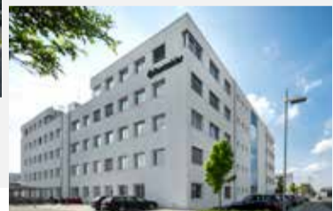
Rentschler Biopharma SE, Laupheim Neubau Laborgebäude